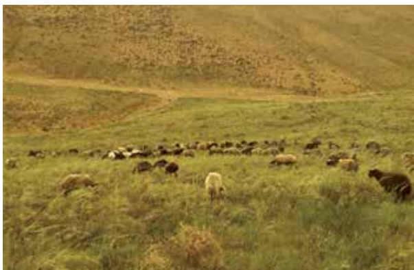
تصویر شماره ۲. پوشش گیاهی مراتع روستای یمق

سیقیر قویروقو (دم گاو)، سارو تیکان (تیغ زرد)، ساقار، سیچان اوتو (غلف موش)، سوتلوگن، یملیک (شنگه)، قیاخ، لس تیکان، توتال تیکان، سوگودک، جیران اوتو، چویان چورگی، دوه بورنو، توخلوباشو، مصطفی چیچگی، چیچک، پیتک، خلفه، گوی تیکان، شقایق، چپیش اوتو، قویون اوتو، قوزو قولاقو، آت یونجاسو، تلخه، سارویونجا، قانقال، قینیرقا، گلین بارماقو (انگشت عروس)، قیرخ پوقوم، دلی شبدر (شبدر وحشی)، قمیش (نی)، ترشک و... از دیگر گونه‌های گیاهی در روستای یمق می‌باشند. علاوه بر گیاهان خودرو، درختان تبریزی و بید و سنجد و گونه‌هایی از درختان خودرو مانند بور، اولقون نیز در