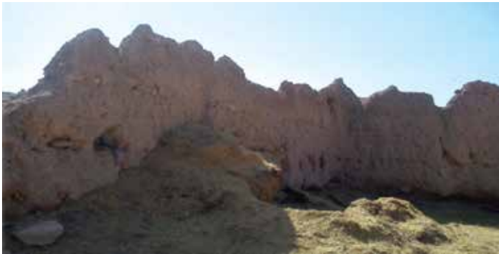
تصویر شماره ۲. بقایای برج و باروی قدیمی روستا